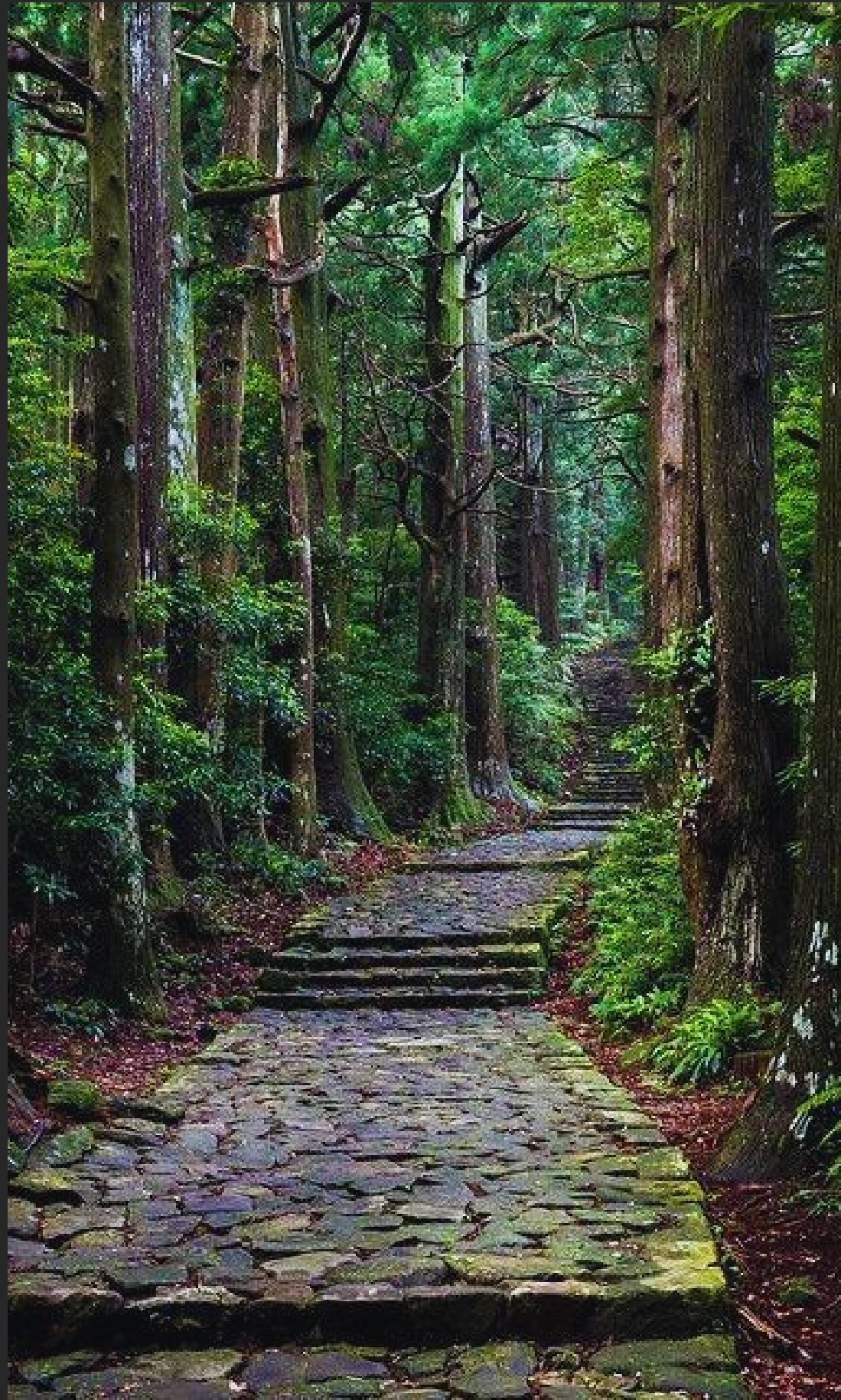
Konsep Jalan Lokasi Folka